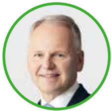
Jari Leppä Keskustan kansanedustaja Maanviljelijä

Metsät ja metsien käyttö ovat kuluneen vaalikauden aikana puhuttaneet. Syystäkin. EU-komission yksilimäinen katsantokanta ja kovakorvaisuus ei ole osoittanut laantumisen merkkejä. Komissio näkee metsät vain ilmasto- ja ympäristöpolitiikan osana. Yritys kaapata metsäpolitiikka komission päätäntävällän alle on kova. Myös kotimaisessa metsäkeskustelussa on saanut huolestuttavasti tilaa pelottelu ja uhkakuvien maalaaminen. Vaarana on, että metsäpolitiikkamme peruseriaatteet hämärtyvät.