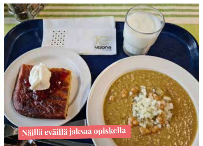
Näillä eväillä jaksaa opiskella